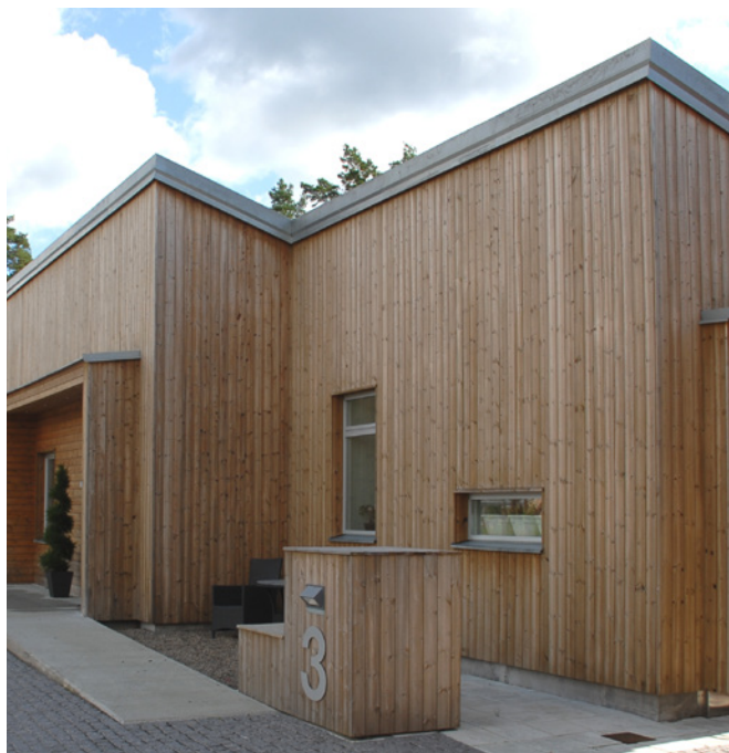
Viskafors i Linax Natur

Hur ofta man behöver beror på underlagets kvalitet och placering samt färg.