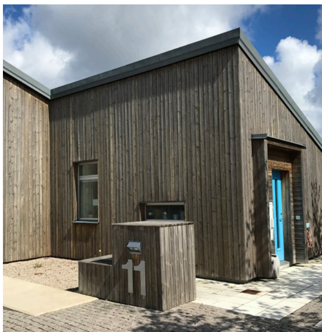
Viskafors i Linax Natur 10 år senare

Underhåll ska göras med Linoljelasyr Linax Natur. Vill man pigmentera upp ytan på Linax Natur kan man själv blanda en olja med lika delar av Linoljelasyr Linax Natur och Linoljelasyr Linax Brun som man sedan påför virket.